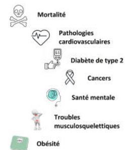
Effets potentiels sur la santé

En France, en 2019, un adulte sur trois combine un manque d'activité physique et une durée des comportements sédentaires trop importante.***